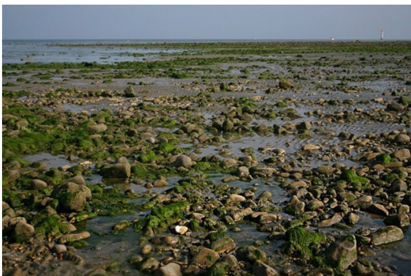
Fin de journée sur l'île de Ré