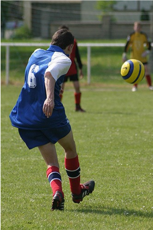
Un footballeur en action