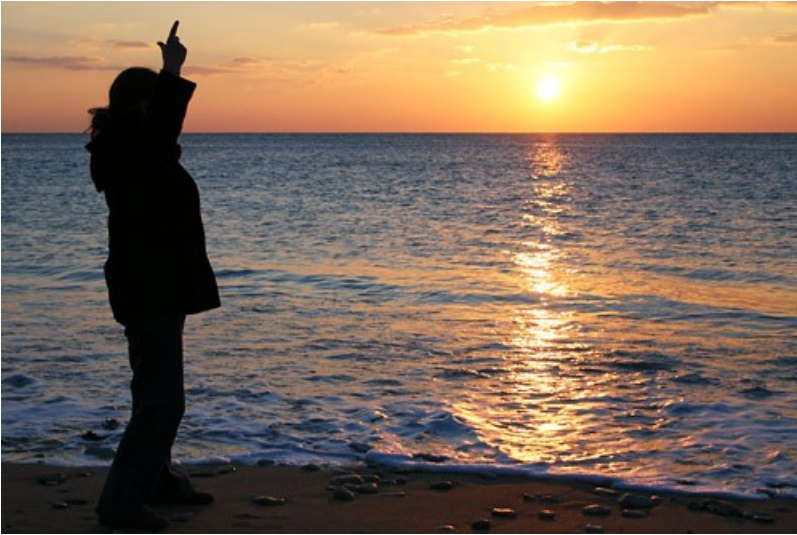
Coucher de soleil sur l'île de Ré