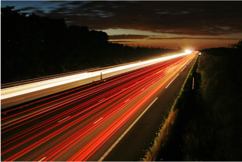
L'autoroute A1 entre Paris et Lille