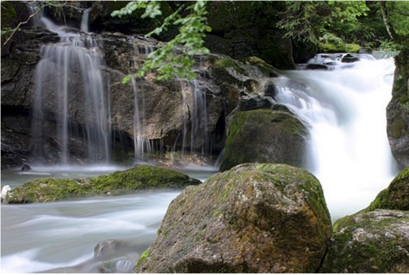
La cascade d'Arden dans les Alpes