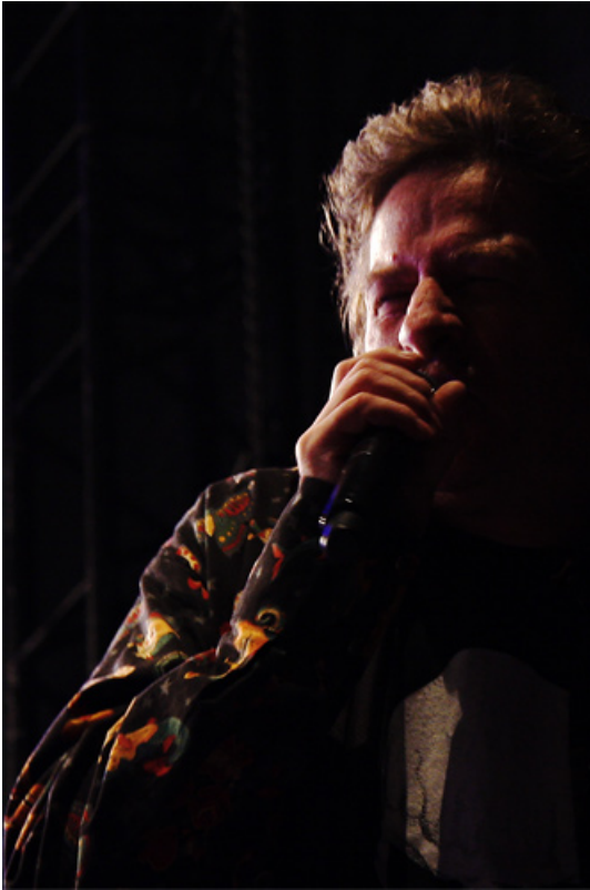
Hubert-Felix Thiefaine en concert